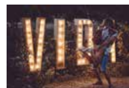
VIDA FESTIVAL Premi Talaia