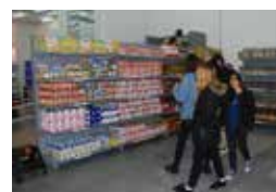
ECONOMAT DE VILANOVA I LA GELTRÚ Premi Garraf